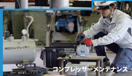
コンプレッサーメンテナンス